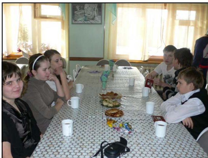
На фото: Блинный пир в 7 классе

Дорогие ребята! Если у вас есть вопросы к учителям нашей школы или вы хотите рассказать о своем любимом учителе, приносите свои работы в пресс-центр!