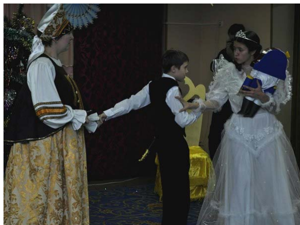
На фото: момент спектакля