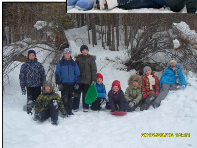
На фото: На турбазе