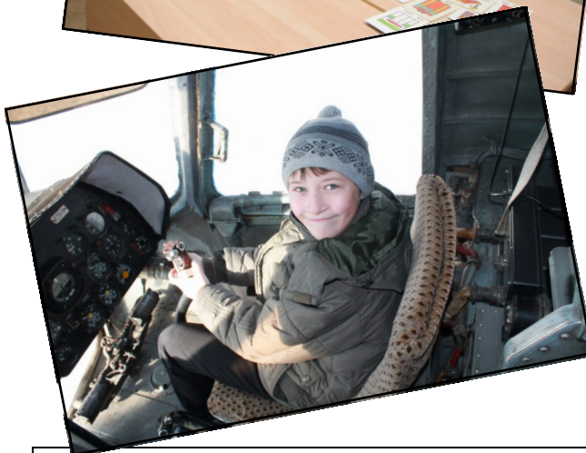
На фото: моменты жизни 4 класса