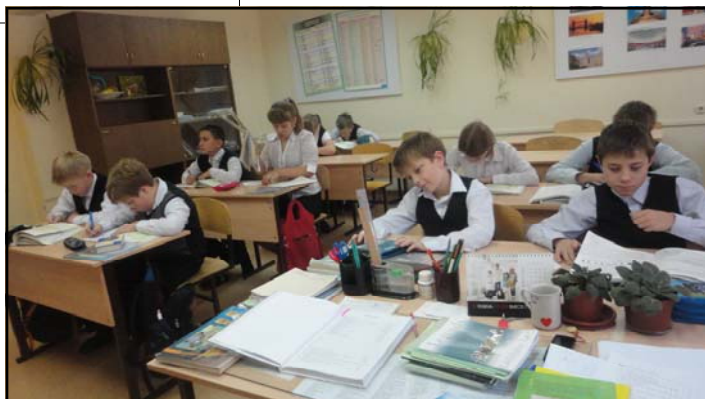
На фото: На уроке английского языка и ИЗО

Ещё мы участвовали в «Дне Здоровья», на котором мы заняли 3 место и получили «титул» «Самый творческий класс». Я считаю свой класс дружным и весёлым. Надеюсь, этот учебный год пройдёт для всех нас интересно и результативно. Желаю всем ученикам закончить первую четверть с хорошими оценками.