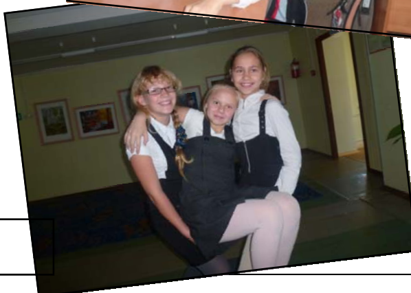
На фото: 5 класс на переменах