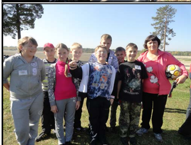
На фото: На дне Здоровья

1б класс, 5 место — 1а класс. Средняя школа: 1 место — 7 класс, 2 место — 6б класс, 3 место — 6а класс, 4 место — 5, 8 классы.