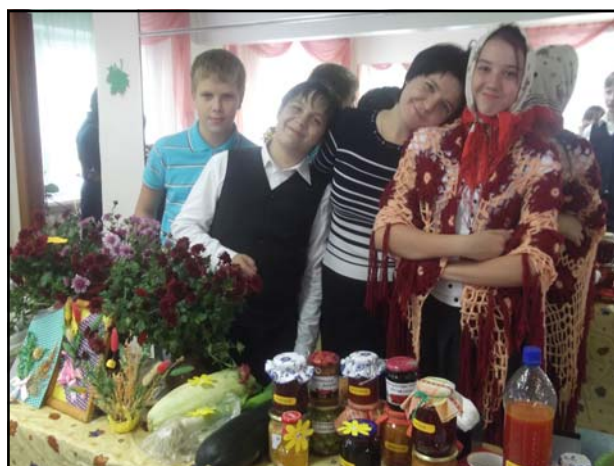
На фото: Ярмарка в разгаре

Реквизиты расчетного счета Иркутского регионального отделения Международной общественной организации инвалидов «Стеллариум» КБ Байкалкредобанк "ОАО г. Иркутск, БИК: 042 520 872, ИНН: 381 003 161 2, Кор/сч.: 301 018 109 000 000 008 72, Расч/сч.: 407 038 103 000 000 000 41 на лечение Кати Казаковой Телефон мамы Кати Казаковой: 8-908-655-0-999, Елена.